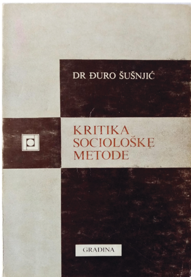
Slika 2: Kritika sociološke metode (1973, korica)