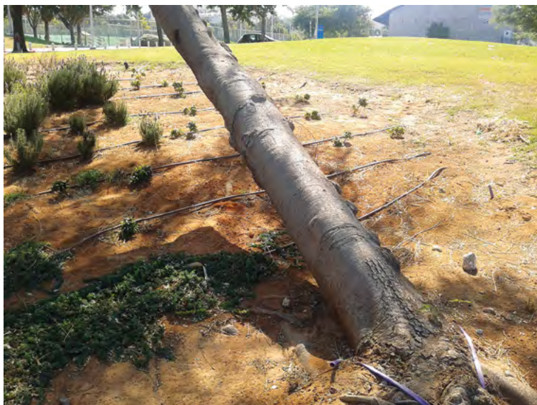
Fotografija 4. Zelena površina pored puta u Tel Avivu (fotografisano 16. 10. 2013. u 11.58)

Jutarnje redovne rituale odlaska na plažu i plivanja, a potom odlaska na predavanja, narušio je dogovoreni izlet u Vitlejem i poseta jednoj dečjoj bolnici iza zida koji je podelio Izrael i Palestinu, iako ta granica nije bila baš najjasnija. Tog jutra autobus je