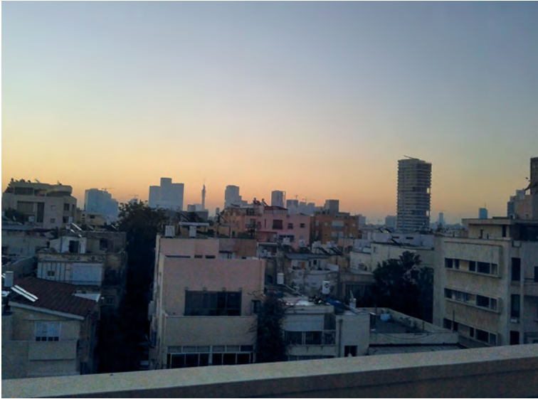
Fotografija 2. Svanje u Tel Avivu (fotografisano 15. 10. 2013. u 06.38)

časova, ustao sam u pola šest kako bih iskoristio toplo jutro na Sredozemnom moru. Plaža je bila odmah preko puta hotela.