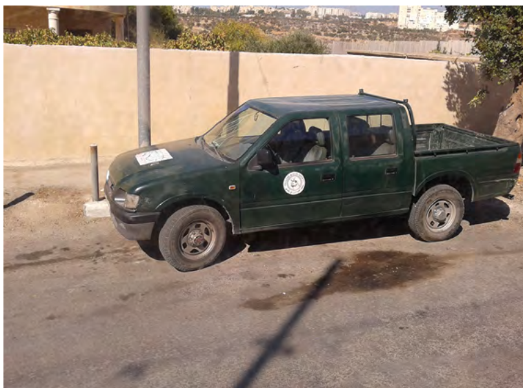
Fotografija 8. Prvi simbol Palestine posle kontrolnog punkta (fotografisano 17. 10. 2013. u 10.26)

lavirint koji je vodio na drugu stranu ili u donji svet. Baš kao i u mitu, susret s dnevnom svetlošću i toplotom sunca me obradova. Prolazili smo pored kolone koja je čekala da uđe u zid iz pravca palestinske teritorije. Poslednjih stotinak metara kolone pri ulasku u zid bilo je ubražđeno i ograđeno metalnom rešetkom, uključujući ne samo stranice nego i plafon. Zatvorska tuba iz koje neumitno teče ljudska masa. Poneki radoznali pogled, guranje i žamor pomešani s dečjim plačom ubrzo su stišali malopredašnje slavljenje susreta sa otvorenim nebom. Na obližnjem putu, parkiran tik uz trotoar, čekao nas je autobus. Pored njega terenac, pickup , japanske proizvodnje sa amblemom preko vrata, „Društvo za zaštitu divljeg sveta Palestine“. Evo prvog simbola posle zida (fotografija 8).