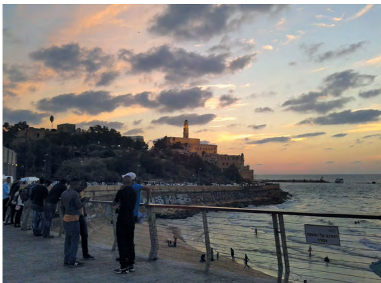
Fotografija 12. Pogled na Crkvu Sv. Petra, u Jafi, u suton na dan Kurban-bajrama (fotografisano 16. 10. 2013. u 18.14)

Na jednom kraju velike zastakljene bašte restorana, nekoliko dugačkih stolova se popuniše budućim slušaocima za tili čas. Pre večere je bilo zakazano predavanje istog profe – generala, koji nam je pre nekoliko dana s lamentom pripovedao o svom neuspelom američkom eksperimentu.