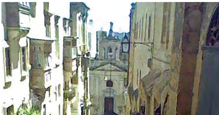
Fotografija 13. Pogled sa vrha na crkvu u dnu ulice (fotografisano 25. 04. 2014. u 13.18)

i činjenica da je Malta među prvim rimskim kolonijama prihvatila hrišćanstvo, a red malteških vitezova je vojno-lekarski red Sv. Jovana iz Jerusalima s početka XI veka. Posle dve hiljade godina, Maltu i dalje zapljuskuju brodolomi i brodolomci.