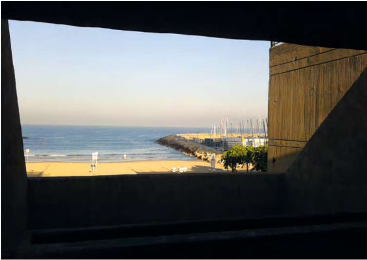
Fotografija 3. Pogled na gradsku plažu i Sredozemno more (fotografisano 15. 10. 2013. u 07.55)

Posle kupanja mi je ostalo još vremena da skoknem do prodavnice koja se nalazila nadomak plaže, po voće i flaširanu vodu i usput pojedem nešto u obližnjim pekarama. Odabrao sam jednu koja je bila ušuškana u stambenom bloku nedaleko od mog hotela. Naručio sam pecivo i kafu, i seo za sto ispred lokala. Na ulicama je još trajala jutarnja gužva zbog odlaska na posao. U pekaru su redom ulazili meštani, a ja sam se usled profesionalne deformacije i da prekratim vreme trudio da po odelu i držanju zamislim ko gde radi i kojeg je zanimanja. Izgledom nisu odstupali od globalne mode. Očigledno ovde metod posmatranja nije dovoljan, pitanje i razgovor bi samo dali odgovor na moj novi hobi.