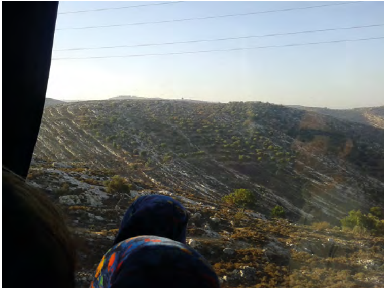
Fotografija 5. Na putu za istočni Jerusalim (fotografisano 17. 10. 2013. u 08.06)

Uskoro smo dobili i mape teritorije kroz koju prolazimo. Iako sam od malih nogu naučio da čitam karte i služim se