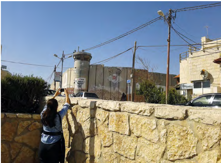
Fotografija 9. Pogled iz bolničkog dvorišta (Vitlejem) na „zaštitni zid“ (fotografisano 17. 10. 2013. u 10.39)

Ono što vas je vraćalo u realnost jeste pogled na ogroman zid koji je od bolničkog parkinga delila samo uska ulica (fotografija 9). Izgleda da mu je nemoguće umaći. Vozeći se ovamo, ostao nam je iza leđa, ali prisećanje na onu haotičnu mapu je bilo otrežnjujuće, kud god pošli sudarićete se s krivudavim zidom. Na njemu su ovaj put i sa ove strane bili tragovi plamena i razbijenih boca s farbom koji su ocrtavali domet bacača. Jedan od njih, potencijalni olimpijski bacač kugle ili diska, uspeo je da pogodi i zatamni neprobojno staklo visoko podignute stražarnice koja je gledala u palestinsko dvorište. Mnogo grafita s porukama mira